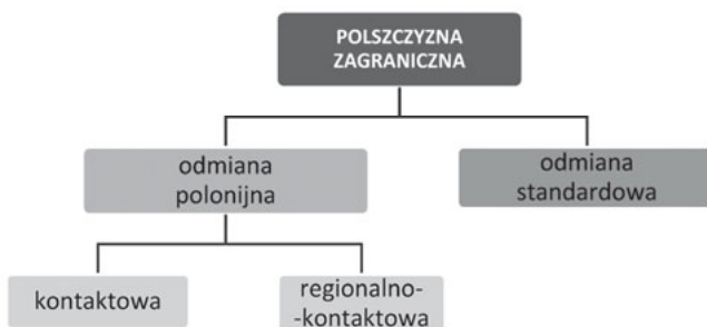
Diagram 1. Podział polszczyzny zagranicznej (opracowanie własne)

Diagram 1 przedstawia graficzną formę (nieco uproszczonego dla potrzeb niniejszego artykułu) podziału zagranicznego języka polskiego (więcej zob. m.in. Miodunka 1990a, 15; Lipińska 2017, 86).